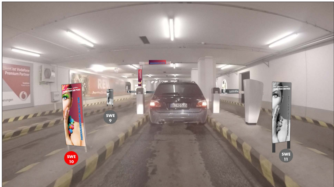
Einfahrtsschrankenbereich | Werbefläche SWE10 | Größe ca. 0,4 x 1,1 m und 2 mal 0,75 x 0,16 m