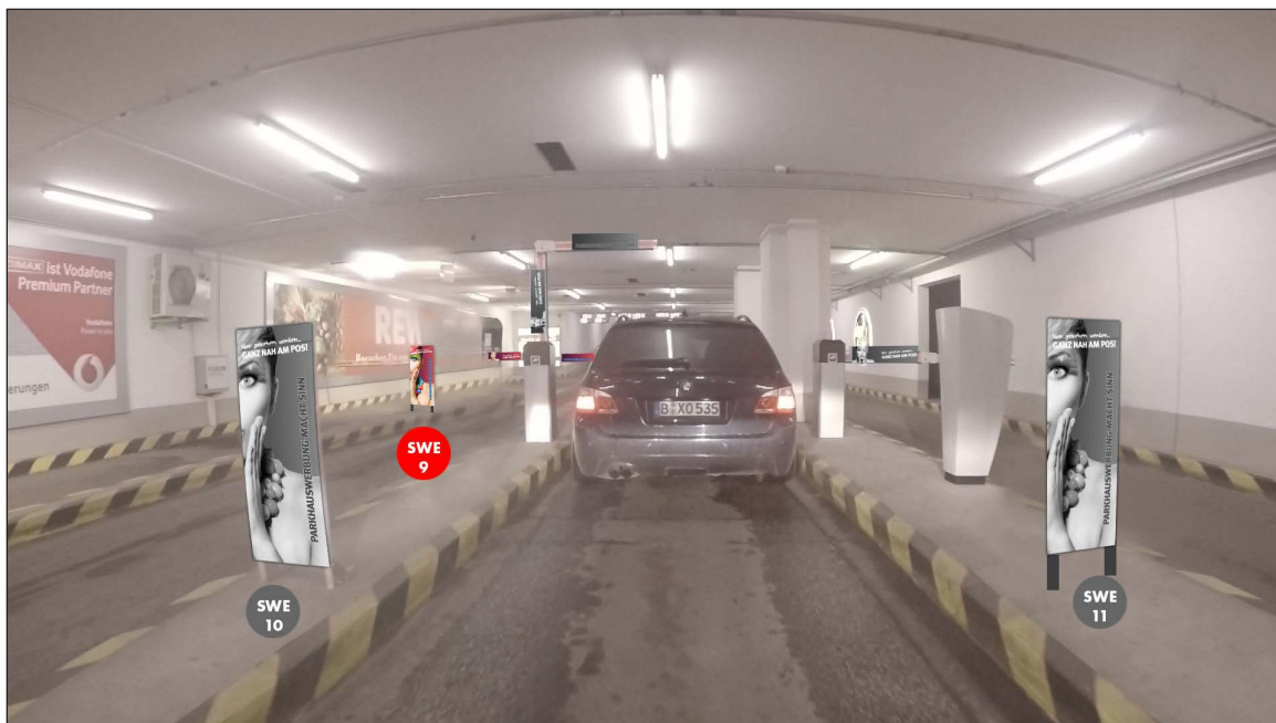
Einfahrtsschrankenbereich | Werbefläche SWE9 | Größe ca. 0,4 x 1,1 m und 2 mal 0,75 x 0,16 m